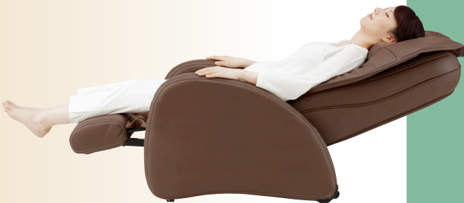
リクライニング時