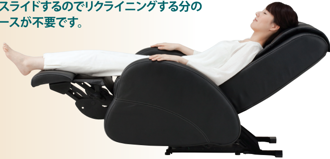
リクライニング時