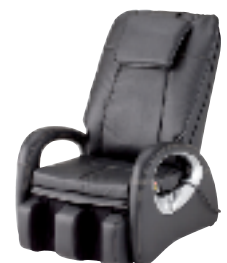
CHD-8200(K) フットマッサージ仕様