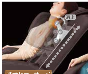
背すじマッサージ