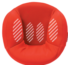
エアバッグ加圧時