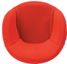
エアバッグ減圧時