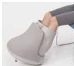
傾けて使用できます