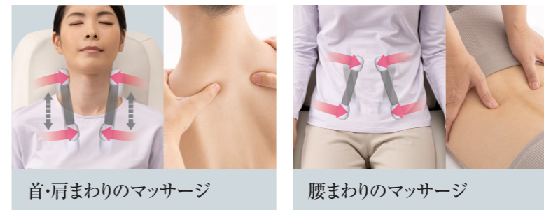
首・肩まわりのマッサージ