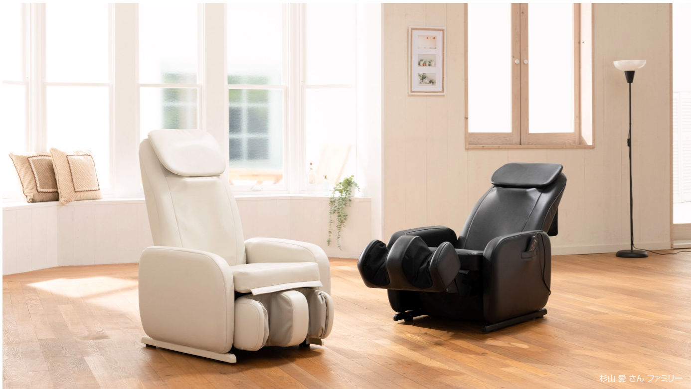
杉山 愛さん ファミリー