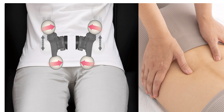
腰まわりのマッサージ