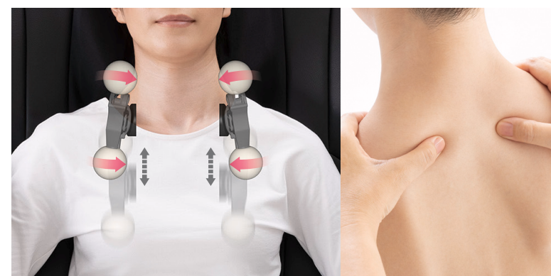
首/肩まわりのマッサージ