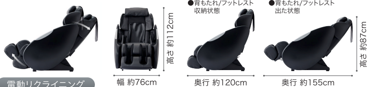
電動リクライニング 背もたれ角度:約113°~約137°