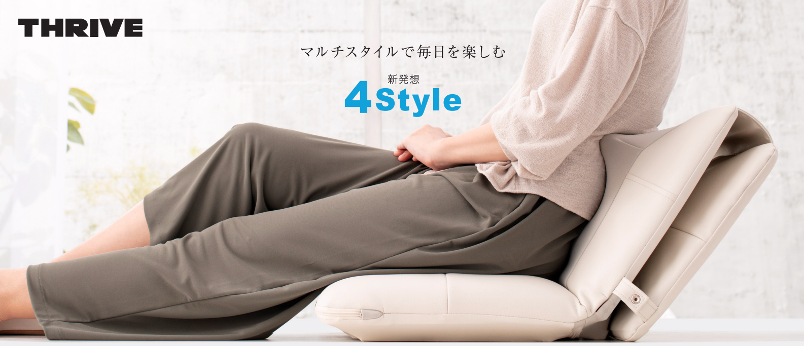
マルチマッサージチェア CMD-1000