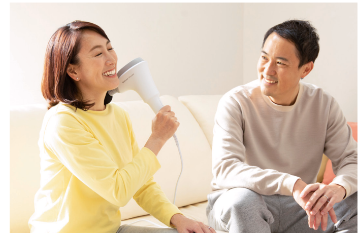
元プロテニスプレーヤー・スポーツコメンテーター 杉山 愛さん ご夫妻