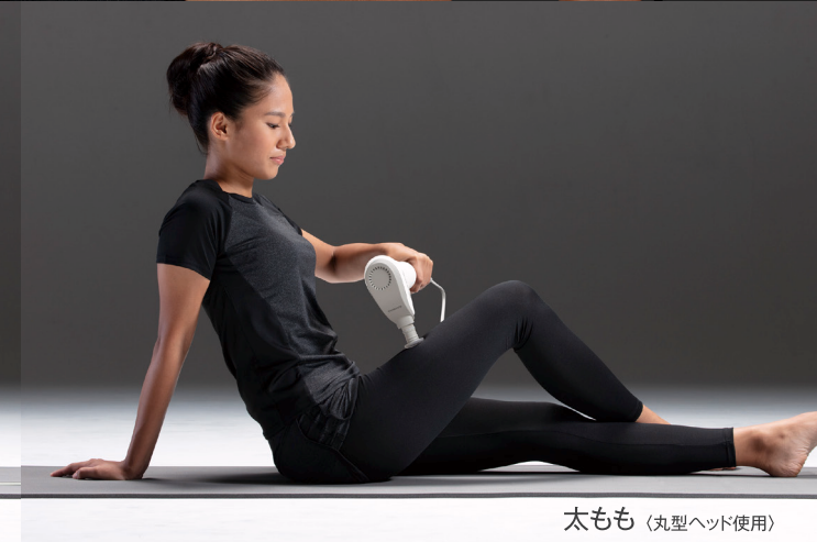
太もも (丸型ヘッド使用)