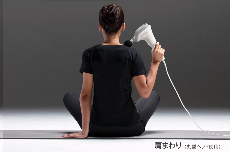
肩まわり (丸型ヘッド使用)