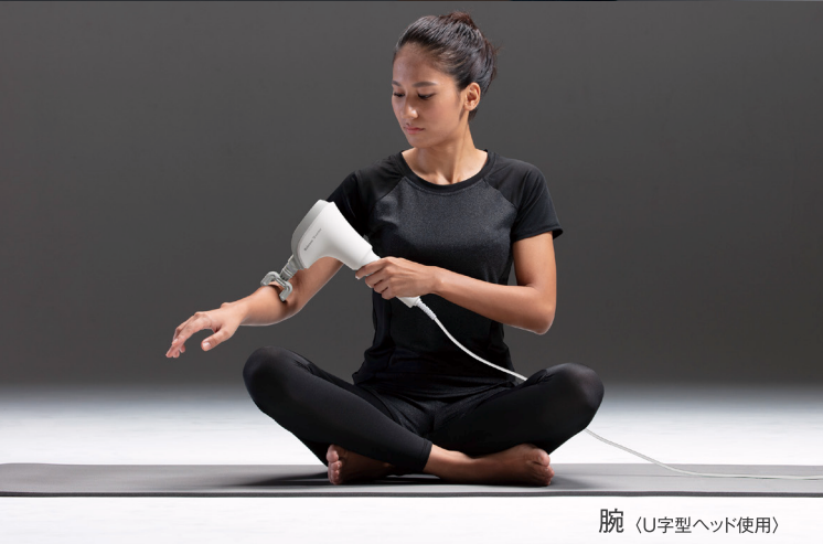
腕 (U字型ヘッド使用)