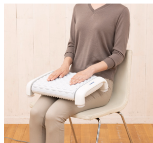
太もも上 太もも上を下振動板で マッサージします。