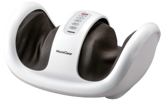
MomiGear もみギア フットマッサージャー MD-4225