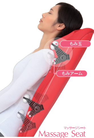
マッサージシート Massage Seat