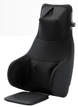
マッサージャー MD-8690 (BK)ブラック

仕様 ●販売名:マッサージャーMD-8690 ●医療機器認証番号:303AKBZX00013000 ●医療機器の種類:管理医療機器 ●一般的名称:家庭用電気マッサージ器 ●定格:AC100V50/60Hz 30W ●定格時間:20分 ●オートタイマー:約10分 ●もみ回数:速:約8回/分 遅:約6回/分 ●質量:約6.6kg ●電源コード長さ:約2m ●材質:本体:ABS樹脂 張地:ポリエステル 座面:合成皮革 ●製造販売元:大東電機工業株式会社 〒577-0026大阪府東大阪市新家東町2-38 ●医療機器製造販売業許可番号:27B2X00055 ●JANコード:(BK)ブラック 4975287608767 ●メーカー希望小売価格:39,800円(税抜価格36,182円)