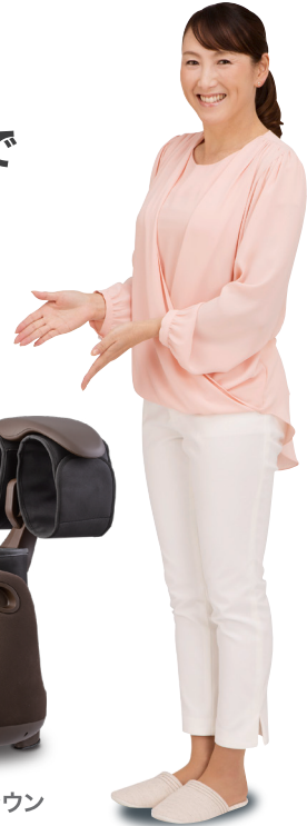
元プロテニスプレーヤー・ スポーツキャスター 杉山 愛